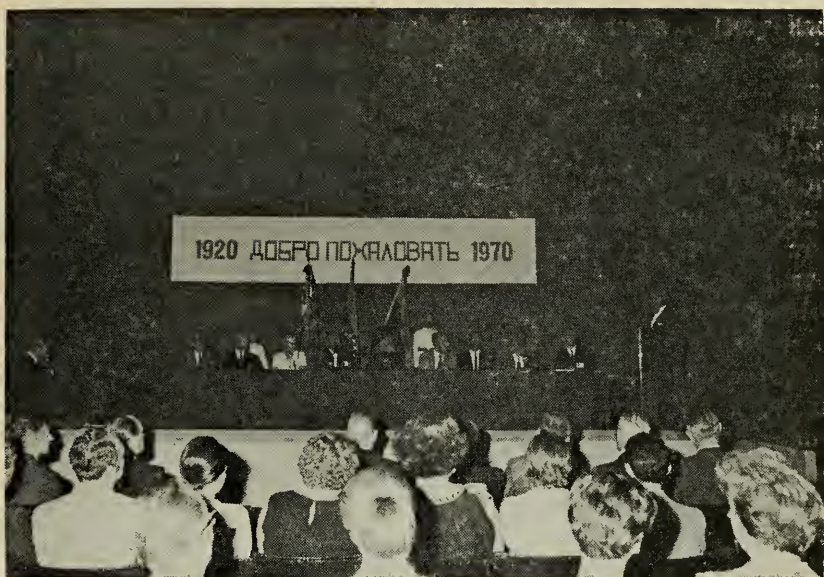
Почетный Президиум Съезда.