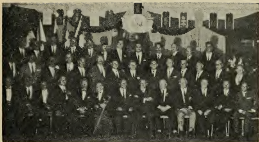
Участники Первого Съезда перед деловым собранием.