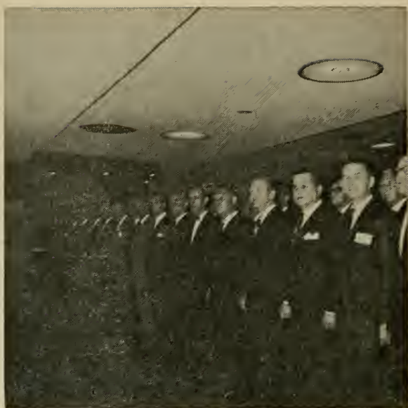
Кадеты в строю для парадной встречи.