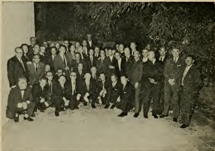
Участники прощального банкета.