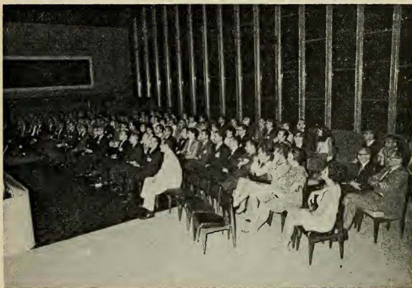
Участники Съезда на открытии.