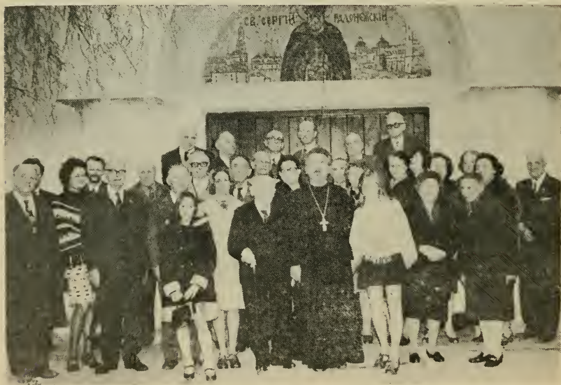
Кадеты Зарубежных Кадетских Корпусов в Аргентине