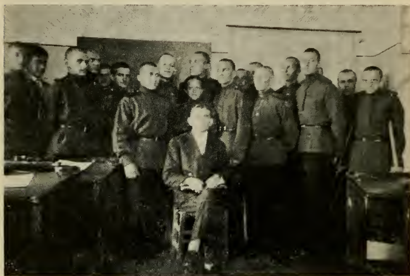
В классе на уроке в 6-м классе в 1932 г.

и вместе с женой иммигрировал в Соединенные Штаты, где обосновался в Глен Кове (штат Нью-Йорк). Несмотря на свой уже пенсионный возраст, он поступил на работу на фабрику дамских сумочек и прослужил там девять лет.