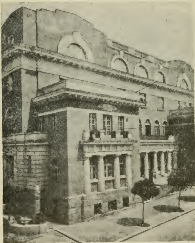
Русский Дом памяти Императора Николая II

Все мы, учившиеся в гимназии, всегда вспоминаем с благодарностью не только страну, принявшую наших отцов и матерей как своих родных братьев и сестер, не только ее Короля Александра, ставившего полный знак равенства между нами и коренным населением страны, но особенно Е. В. Королеву Марию, лично принявшую под свое Высокое Покровительство нашу женскую гимназию.