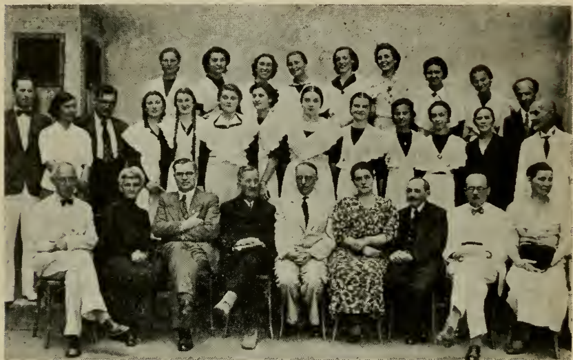
Матюра 1938 года.

Так, из года в год, с радостями и огорчениями, с переэкзаменовками, а иногда и с повторениями, шли выпуски за выпусками, каждый год покидавшие Русский Дом для новой жизни. Все шло гладко и, казалось, все будет так и дальше. По приблизительному подсчету число окончивших наши обе гимназии приближался к 800-стам. Отметим также, что значительное большинство из них получило и высшее образование.