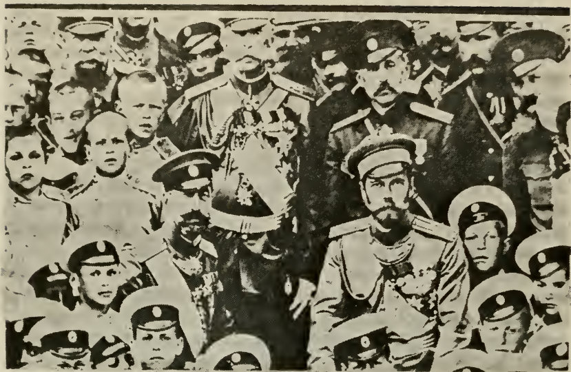
Государь и Вел. Кн. Константин Константинович среди кадет, Полтава 1909 г.