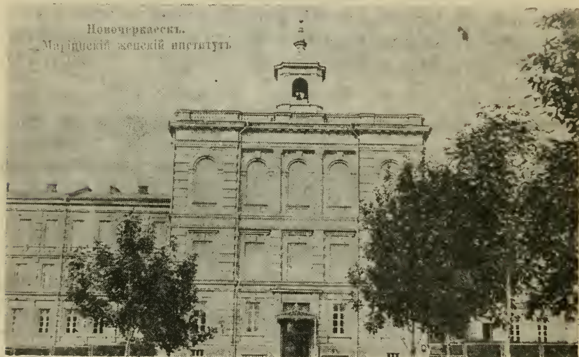
Мариинский женский институт в Новочеркасске.

Точную дату основания института в Новочеркасске установить трудно, но по историческим данным известно следующее: императрица Мария Феодоровна, жена императора Павла I, не игравшая при императрице Екатерине II никакой роли, по вступлении на престол Павла, начала заниматься вопросом женского образования. Уже через шесть дней по смерти Екатерины, последовало повеление императора «начальствовать его супруге над воспитательным Обществом Благородных Девиц». Цель женского образования, по мнению Марии Феодоровны, заключалась в том, чтобы «способности учащихся употреблять не только для образования ума, но и для образования сердца и характера». В царствование Александра I и Николая Первого были основаны институты в Санкт-Петербурге, Москве, Симбирске, Новочеркасске, Харькове, Полтаве и других городах. В каком именно году был основан институт в Новочеркасске мы не могли установить.