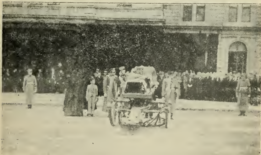
Король принимает последний парад... перед вокзалом в Белграде. От Российского Царственного дома присутствовали: Вел. Кн. Елена Владимировна, Вел. Кн. Мария Георгиевна, Кн. Татьяна Константиновна, Кн. Вера Константиновна и кн. Т. Багратион-Мухранский — юнкер*.