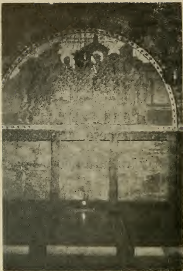
Лампада на гробнице Короля в усыпальнице в Опленце. Слева гробница Его матери Княгини Зорки, справа предполагаемая гробница Его супруги Королевы Марии, временно похороненной в Англии.