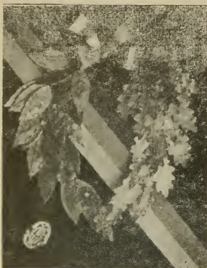
Серобранный венок от Союза Русского Сокольства