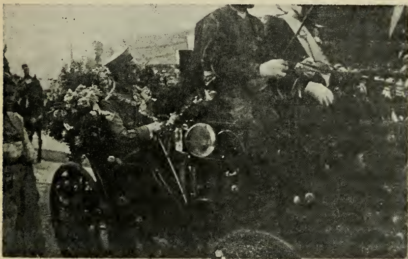
Въезд Регента Александра в Сараево в 1920 г.