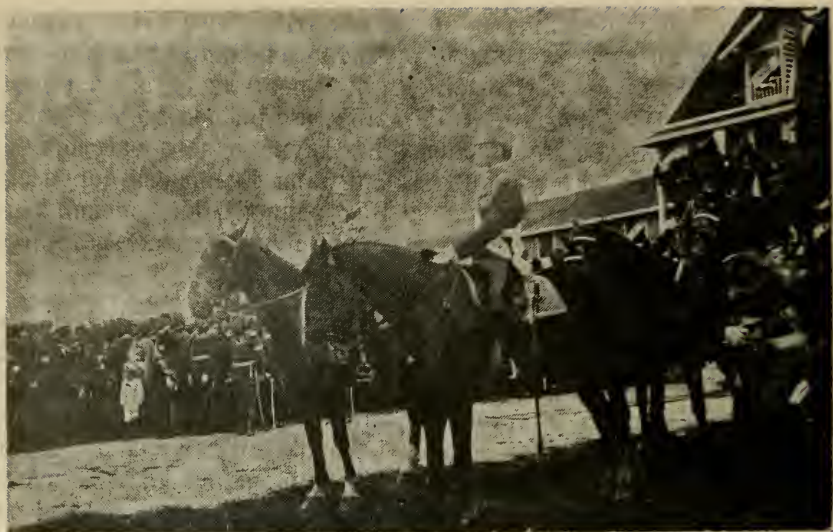
Король Александр и Король Фердинанд на параде по поводу создания Малой Антанты

В 1924 г. в целях консолидации отношений с Италией, подписан пакт дружбы и сердечного сотрудничества, известный под названием «Римский пакт».