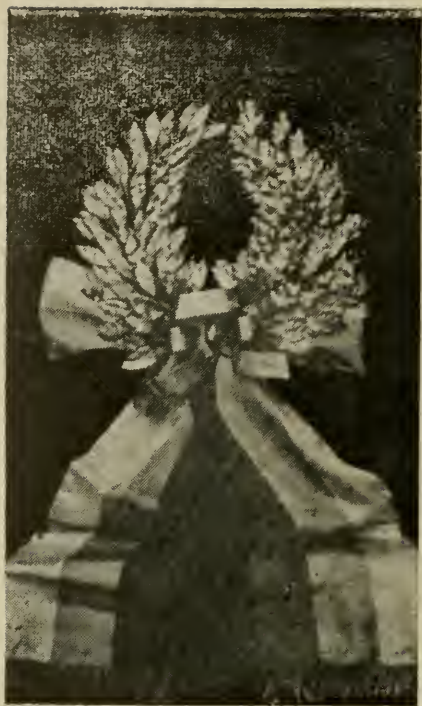
Серебряный венок от русской эмиграции в Югославию