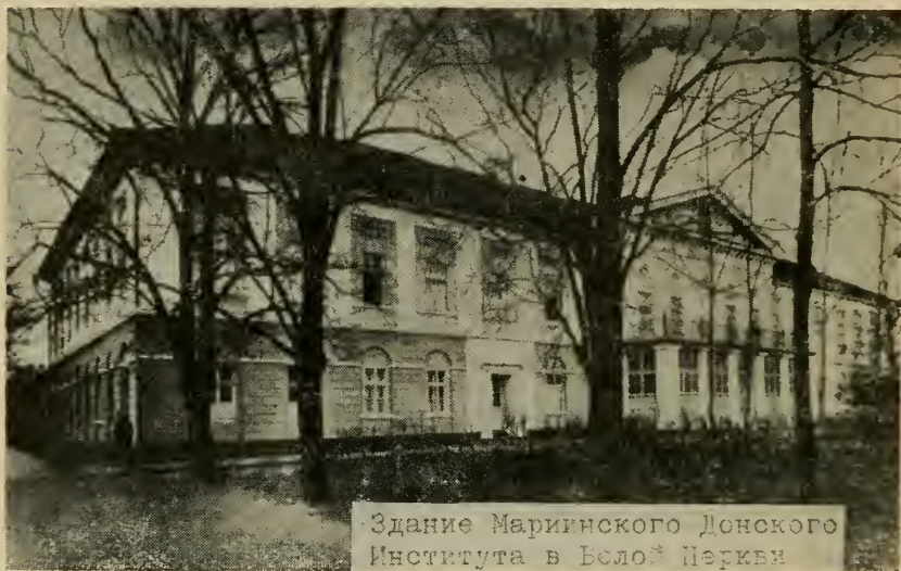
Здание Мариинского Донского Института в Белой Церкви.

Мариинский Донской институт в Белой Церкви занимал большое красивое здание в центре города, удобное тем, что в