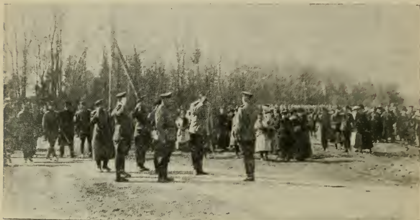
Командант школы принимает рапорт по прибытии во главе делегации в Стрнице

русские народные танцы и пели под аккомпанимент балалаек. Члены нашей делегации были очень расстроены, видя в каких бедных, полных лишения, условиях находятся русские кадеты (спали на досках).