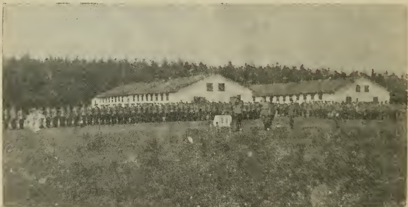
Торжественная встреча в Стрнице — исполнение югославянского гимна.

Через некоторое время в Высшую военную реалку прибыла делегация воспитателей и кадет из Стрница с ответным визитом. Прием был очень сердечным и радостным. После обильной закуски в большом и красиво декорированном гимнастическом зале был устроен вечер с танцами.