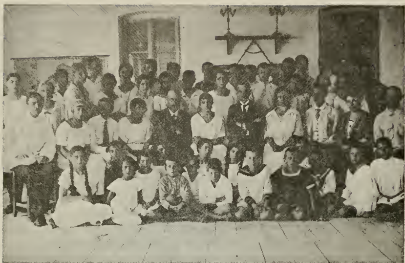
Группа преподавателей и учеников — 1922 г. — Русской Гимназии в г. Херцеговни.

дей, явился только этапом на общем эмигрантском пути. Жизнь ставила свои проблемы, разрешение которых требовало иных действий, несовместимых с местными условиями. К тому же, средства отпущенные Всероссийским Союзом Городов нашей гимназии, подходили к концу, что ставило под вопрос ее дальнейшее существование.