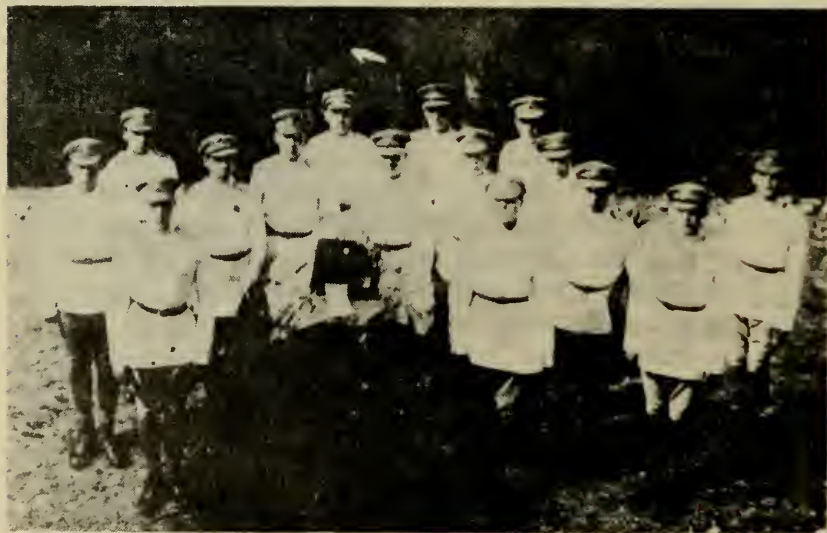
Прощание со "Звериадой", 1923 г. Сараево

Ежегодно, в конце года, на лоне природы за городом происходило прощание очередного выпуска Киевлян со «Звериадой» и передача ее новому «патриарху» следующего выпуска, после чего происходил парад, который принимали выпускные кадеты и новый «патриарх» со «Звериадой». На это торжество, все кадеты Киевляне надевали белые погоны своего родного корпуса.