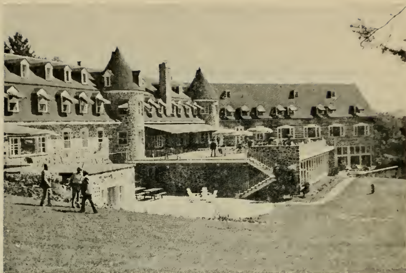
Гостинница "Шантеклер" — место предполагаемого 5-го Съезда