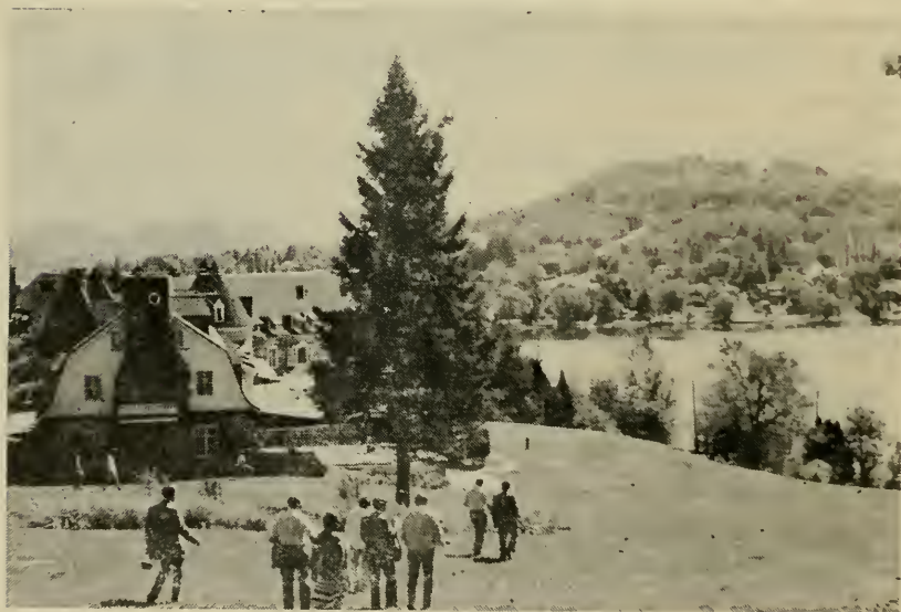
Представители 3-х Объединений осматривают всю территорию