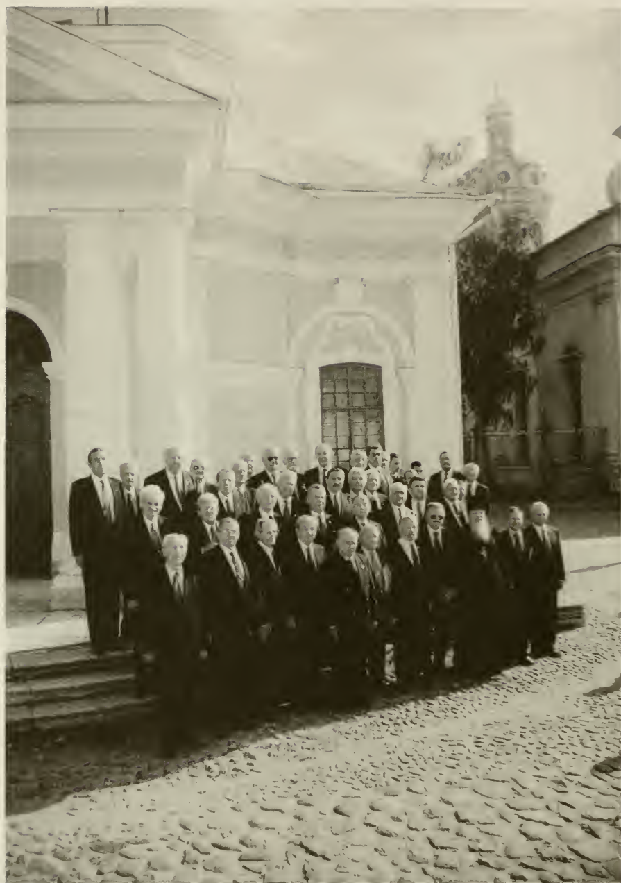
XVI съезд кадет Российских кадетских корпусов и Первый в России. Группа приехавших кадет в Петропавловской крепости