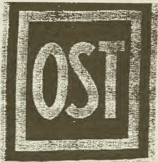
Матерчатый знак OST в натуральную величину