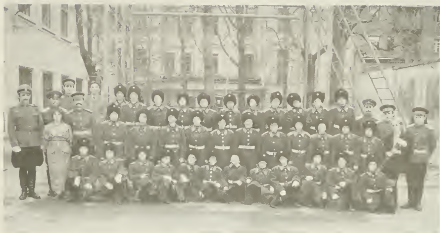
Группа кадет 2-го Донского Императора Николая II кадетского корпуса (Ростов-на-Дону) с директором и офицерами-воспитателями