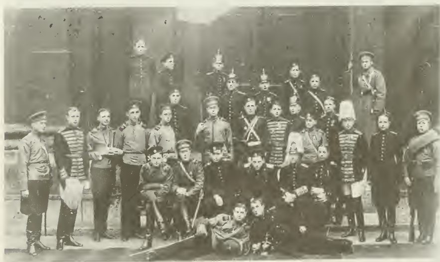
Кадеты Пажеского Е. И. В. корпуса в формах пажей (с 1802 – 1918 гг.)