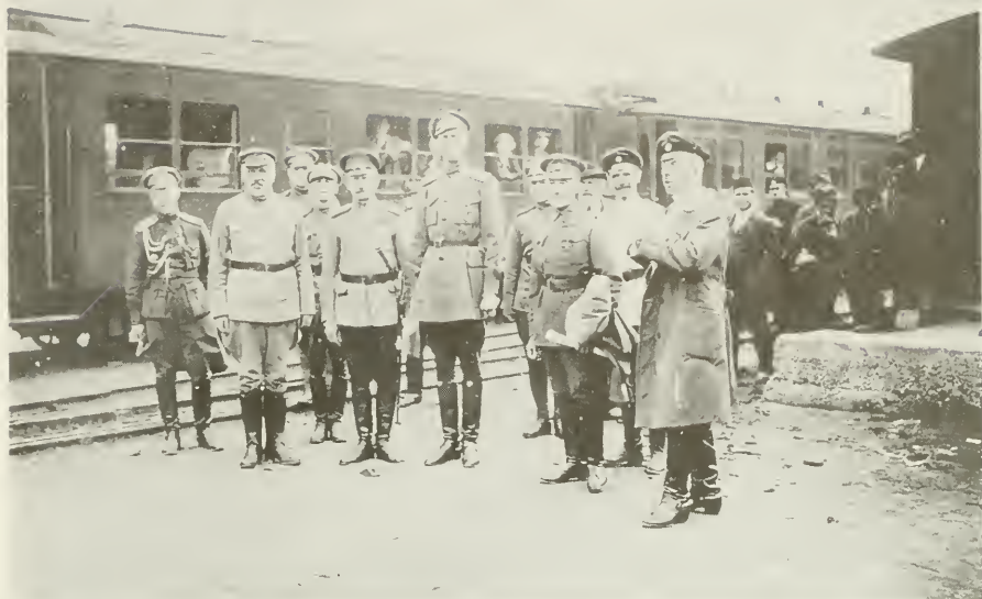
Генерал Врангель с директором Русского кадетского корпуса ген.-лейт. Б. В. Адамовичем и офицерами-воспитателями