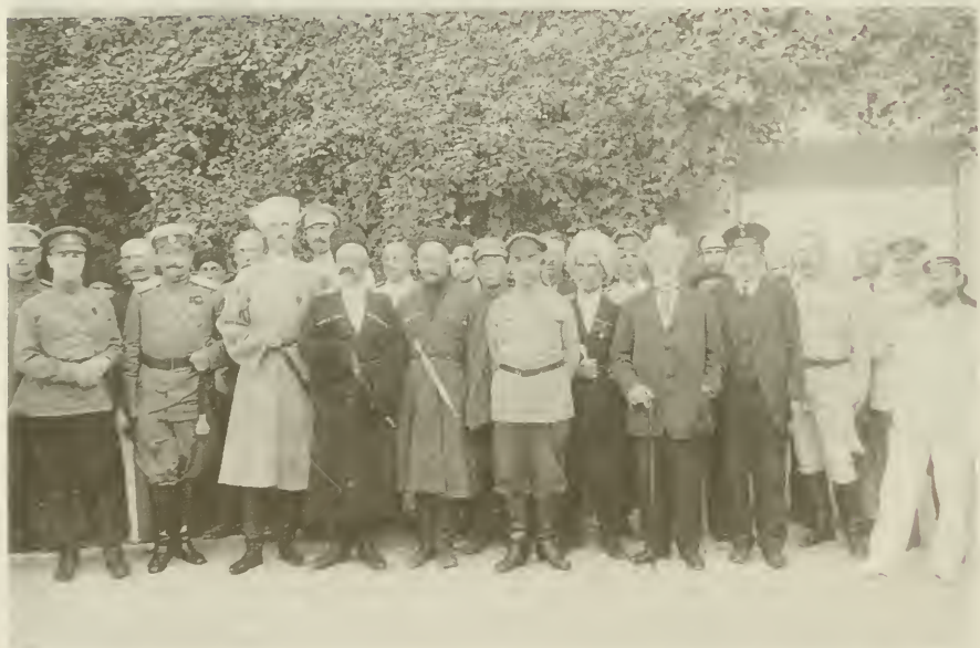
Генерал Врангель с членами правительства юга России и войсковыми атаманами