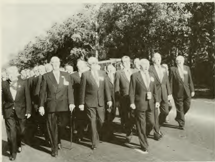
Кадеты маршируют с песнями по улице в Москве