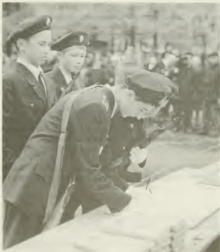
Кадеты Ижевского кадетского корпуса впервые дают торжественную клятву. 1997 г.