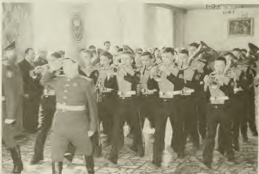
Оркестр Сибирского кадетского корпуса (Новосибирск)