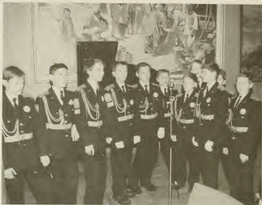
Хор Первого Московского государственного кадетского корпуса