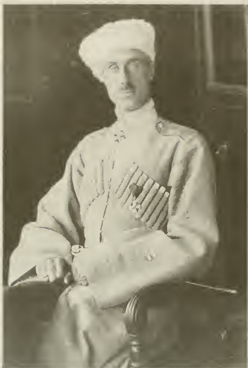
Генерал барон П. Н. Врангель, Правитель юга России и Главнокомандующий Русской армии. Севастополь, 1920 г.