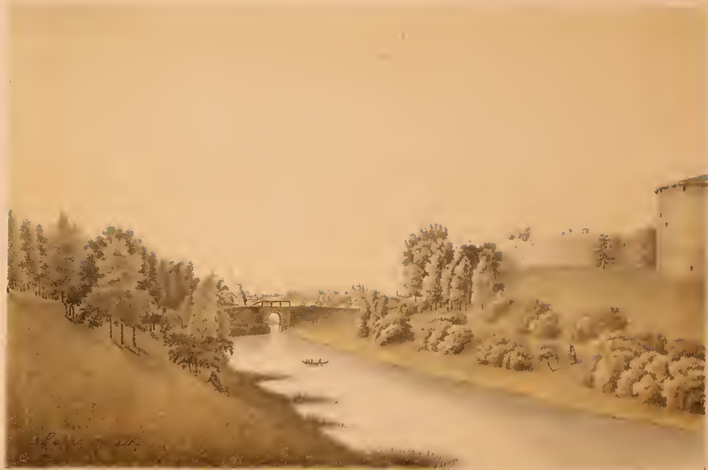
ВНДЪ КРЕМЛЯ И ЧАСТИ ТОРГОВОЙ СТРОНЫ ИЗЪ ГОРОДСКАГО САДА.