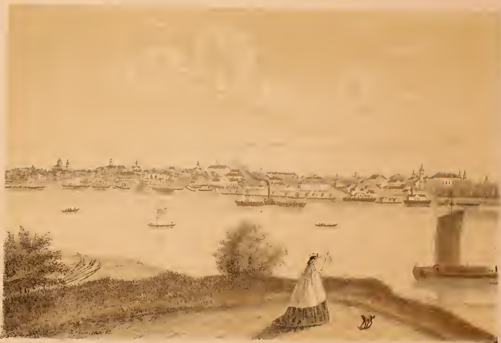
Рис. из галереи имп. Эрмитажа