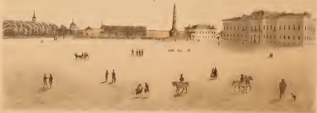
THE GREAT SQUARE, ST. PETERSBURG, RUSSIA