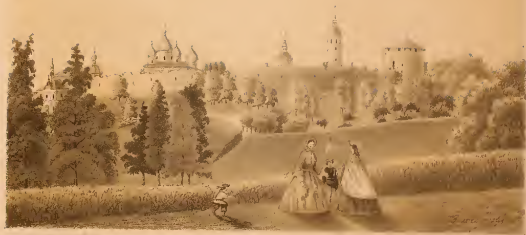
ВІДЪ КРЕМЛЯ ИЗЪ ГОРЬДІКАГО МѢСТА.