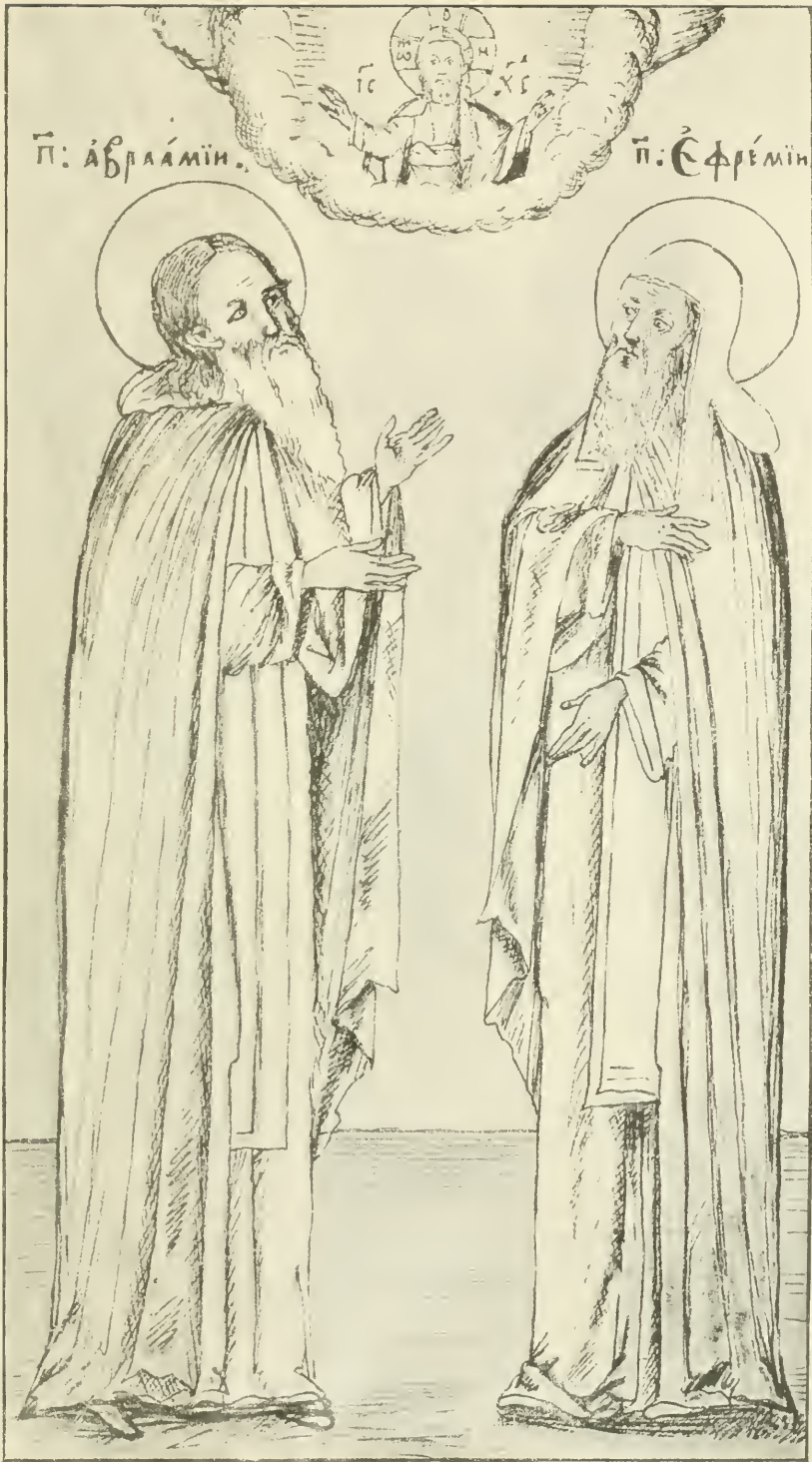
Препп. Авраамій и Ефремъ.

Изъ рукописи Смоленской Духовной Семинаріи № 78, XVII вѣка.