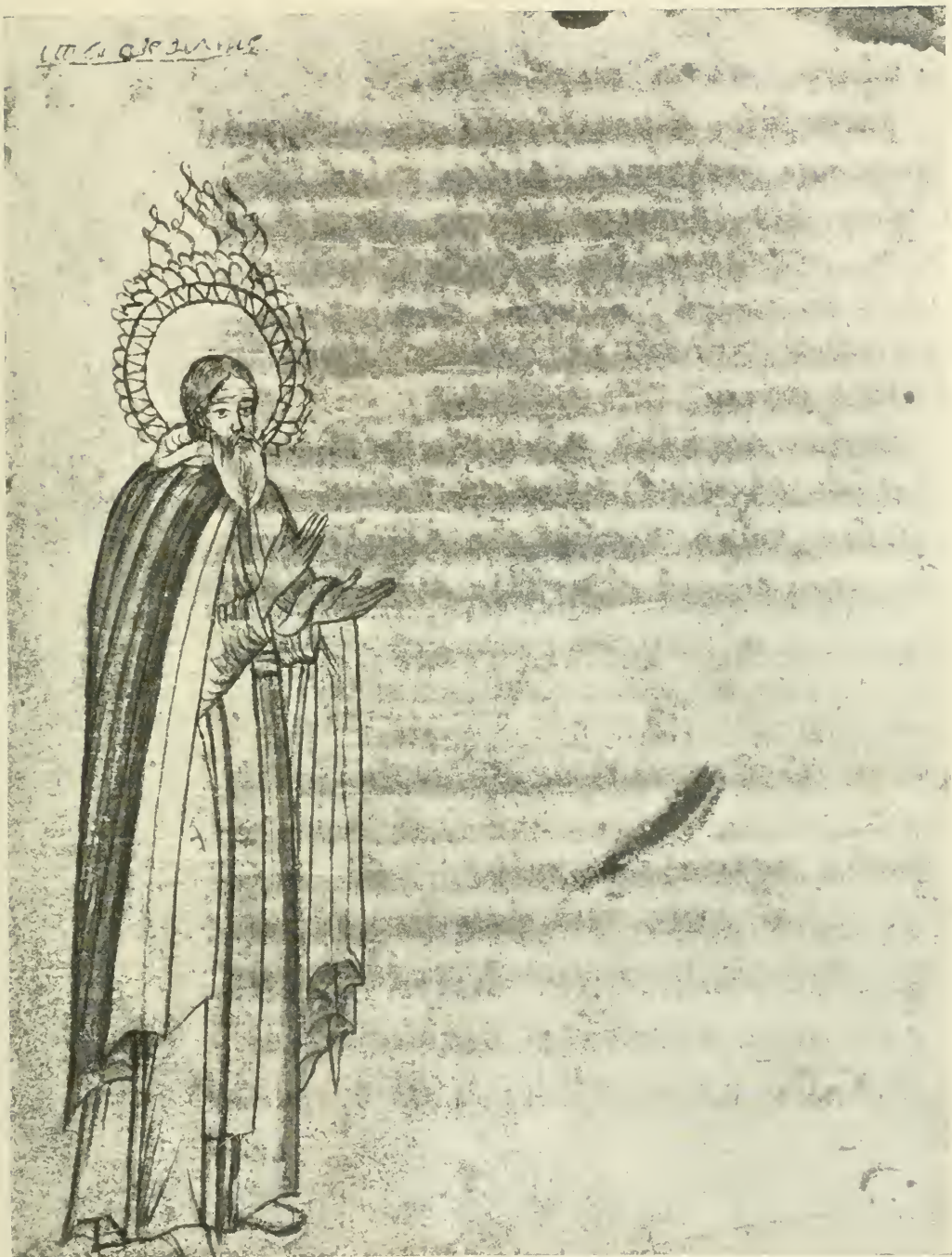
Преп. Авраамій Смоленскій.

Изъ рукописи СПб. Синодального Архива № 1318, XVII вѣка.