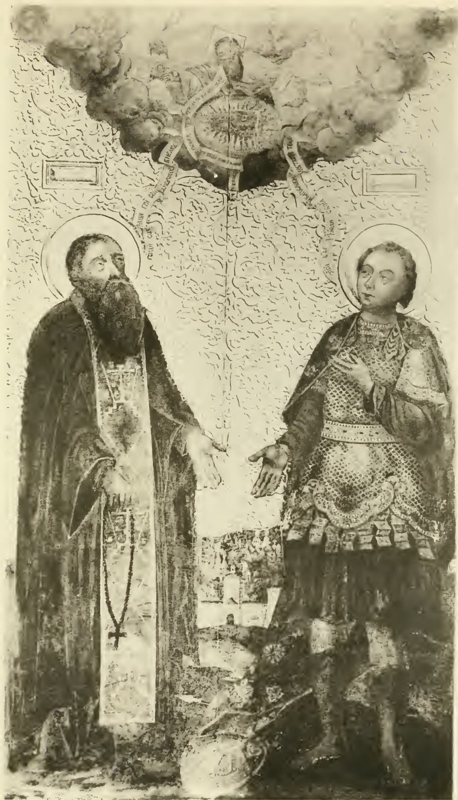
Преп. Авраамій и св. Меркурій.

Снимокъ съ иконы письма нач. XVIII в., находящейся въ иконостасѣ церкви села Сверчкова, Смоленской губ.