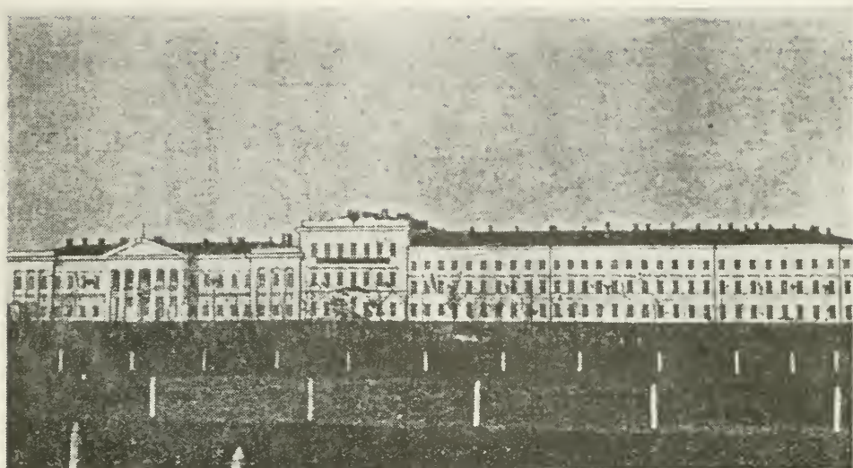
Передний фасадъ здания, подвергнувшійся обстрѣлу красноармейцевъ 6-го февраля 1918 г