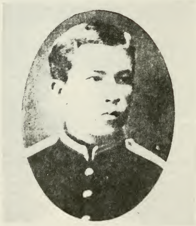
Кадет Л. Корнилов

Лавр Георгиевич Корнилов (Л.К.) поступил в корпус в 1883 году и окончил его вице-фельдфебелем в 1889 году. Во всех классах