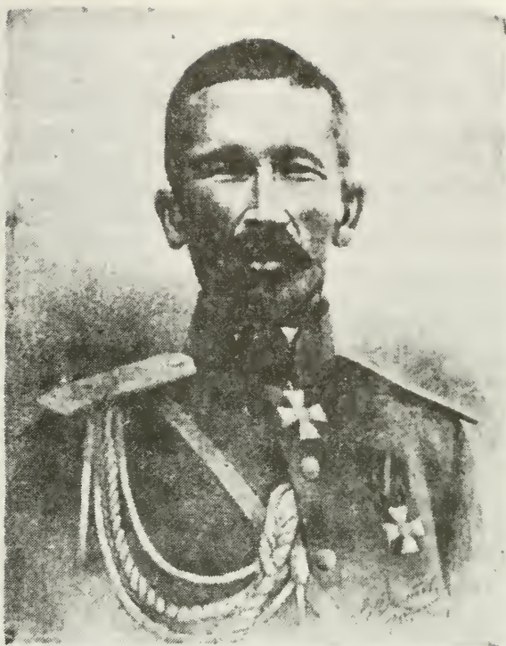
КОРНИЛОВъ Лавръ Георгіевичъ, Генераль-Лейтенантъ. (выпуска 1889 года).

в корпусе он был старшим кадетом. Л.К. кончил Михайловское артиллерийское училище и вышел в Туркестанскую артиллерийскую бригаду, где, помимо службы, изучал туземный язык. В 1898 г. он кончил Военную Академию Генерального Штаба и, отбыв полевые занятия в Варшавском округе, возвратился в Туркестан и получил задание на глубокую разведку в Афганистане. Верхом, одетый туземцем и владеющий туркменским языком с лицом монгольского типа, он удачно совершил эту разведку и возвратился на Русскую землю вплавь через реку Аму-Дарью, вызвав стрельбу по нему афганцев. Командующий войсками Туркестанского округа остался недоволен этим происшествием. Его рапорт дошел до Государя, и он написал на нем: «Капитан Корнилов — молодец». Затем Л.К., служа в Ташкентском округе, совершил командировки в Кашгарию, Хоросань, Сейсан и Индию. В 1901 году с четырьмя казаками совершил семимесячную поездку по восточной Персии, пройдя пустыни, считавшиеся непроходимыми. Поздней исследовал горы Ку-энь-лунь, Тянь-Шань и пустыни Сей-Сана. В 1903 г. Л.К. получил командировку в Индию и выпустил