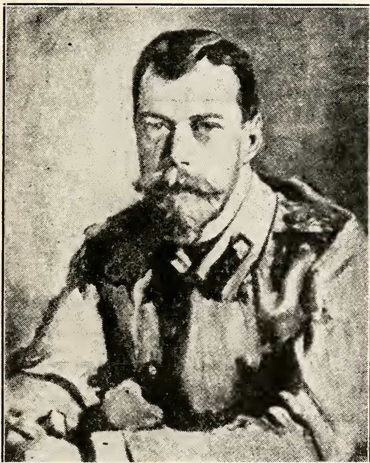
ГОСУДАРЬ ИМПЕРАТОРЪ НИКОЛАЙ АЛЕКСАНДРОВИЧЪ