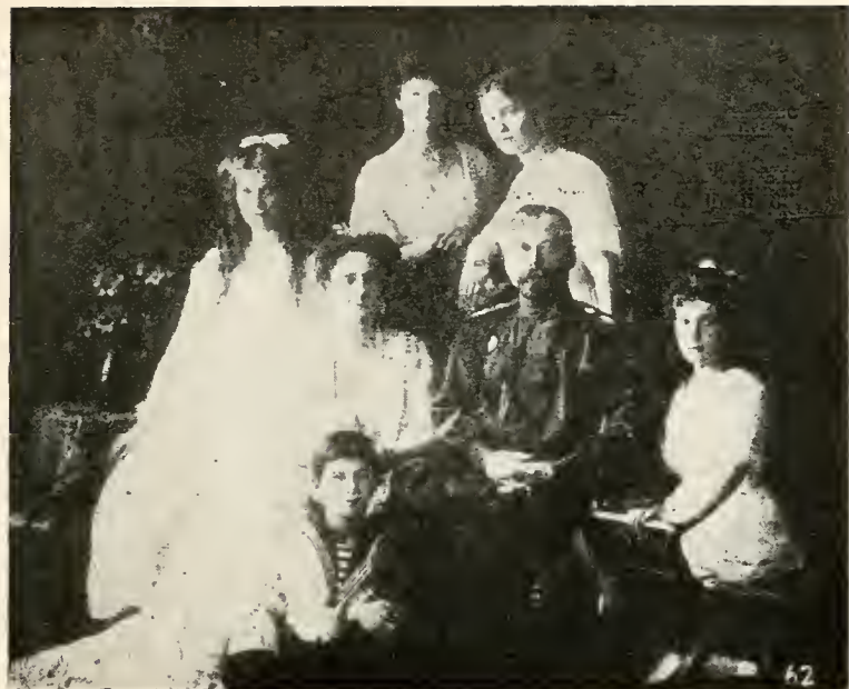
Государь Императоръ Николай II и Его Августѣйшая Семья.

скій въ дѣйствіи. Шведы повали, что ученикъ оказался способнымъ.