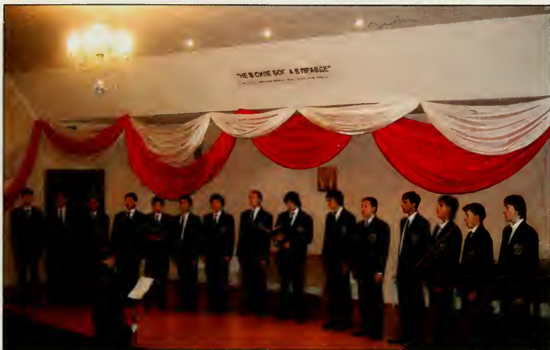
Хор музыкальной школы Екатеринбурга