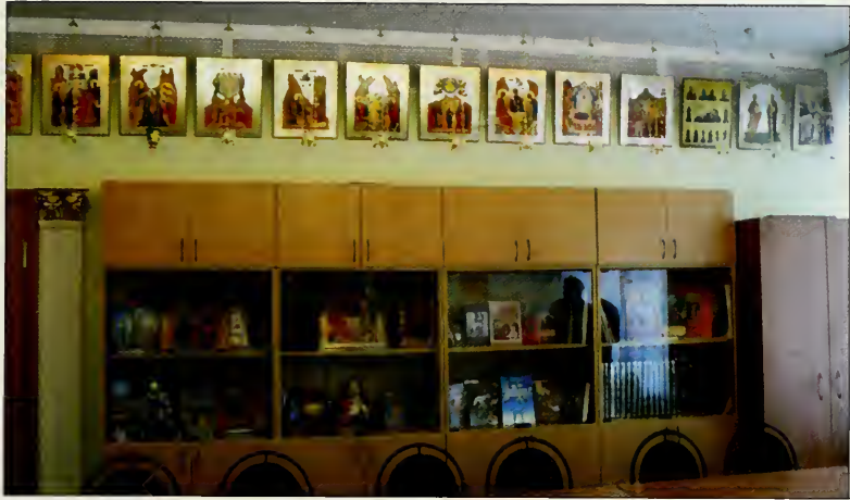
Классное помещение в Московском Морском Корпусе