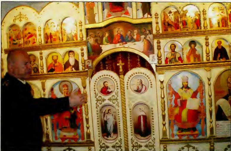
Директор ММК показывает еще незаконченную часовню