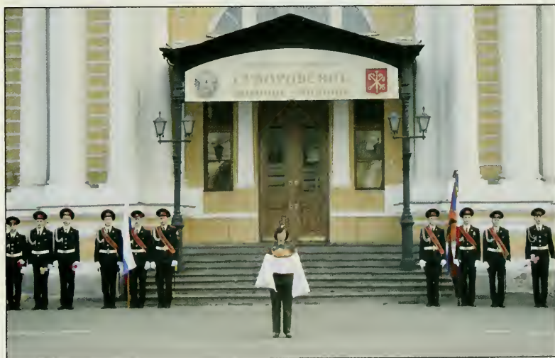
Прием с хлебом и солью в Суворовском Училище