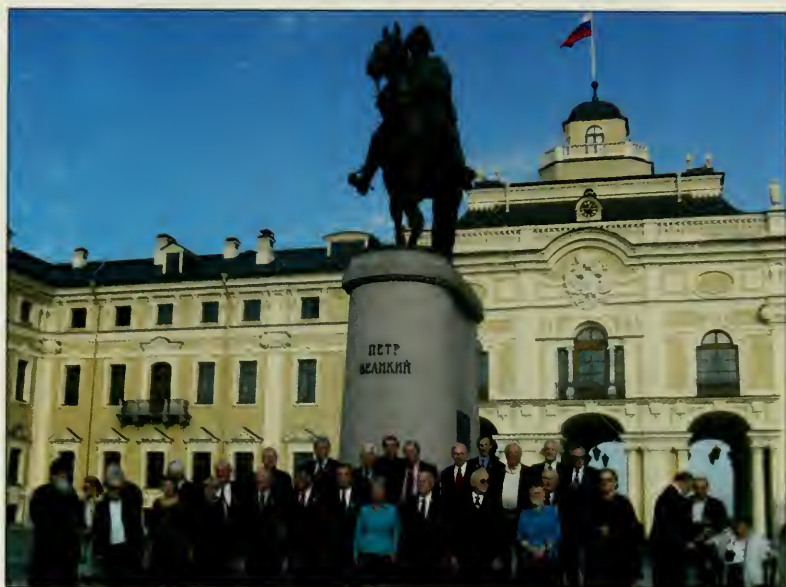
Перед памятником Петру Великому