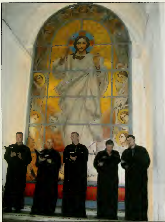
Кинтет Петропавловского Собора поет: «Мати Божия, сохрани Христолюбивое Воинство и Царство Российское»