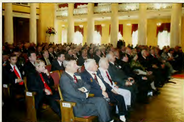
Зал заседаний Первого Съезда