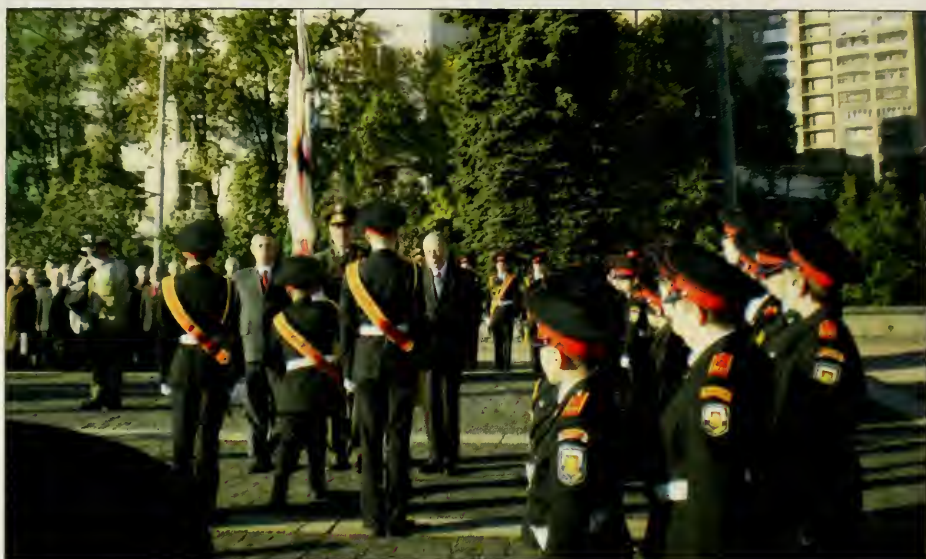
Передача знамени Фанагорийского полка