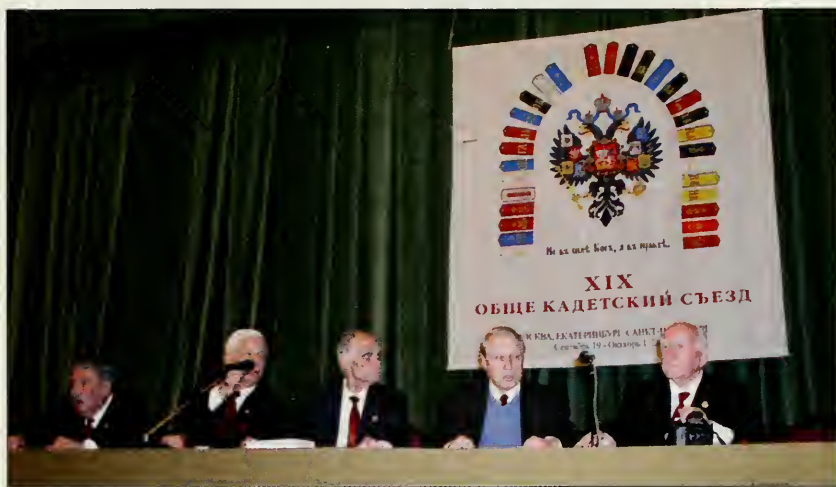
Президиум XIX Кадетского Съезда