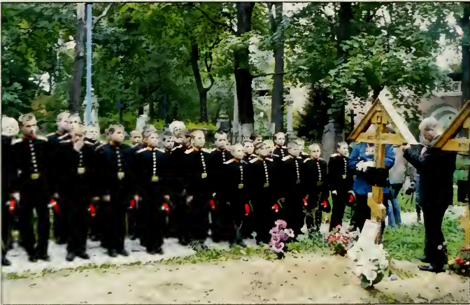
Лития в Донском Монастыре перед могилами И. А. Ильина и генералов А. И. Деникина и В. О. Каппеля