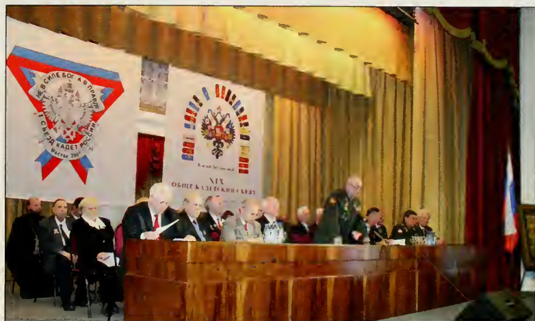
Президиум Первого Съезда кадет России