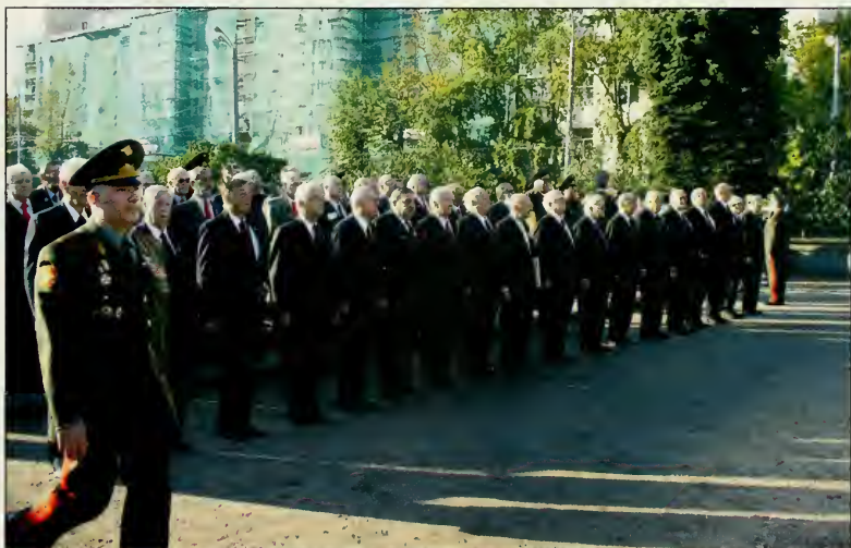
Строй русских зарубежных кадет