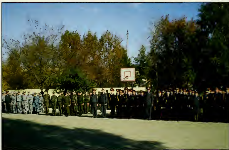
Строй кадет Лицея Милиции