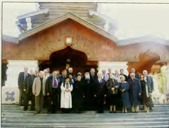
После Божественной Литургии в монастыре