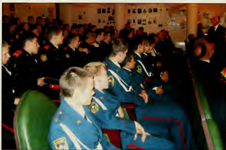
М. А. Лермонтов обращается к кадетам Екатеринбурга