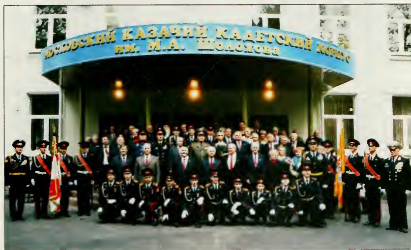
Посещение Московского Казачьего Корпуса