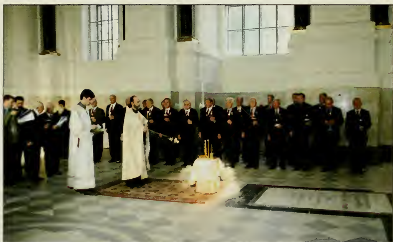
Лития у могилы Великого Князя Константина Константиновича