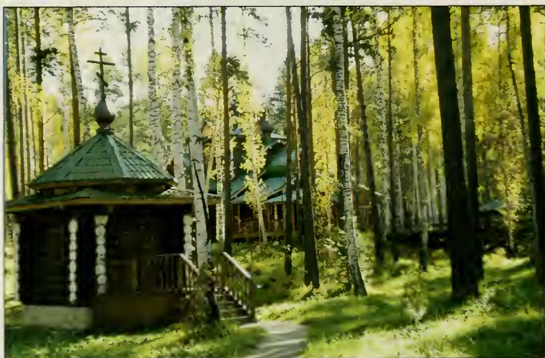
В монастыре Св. Царственных Стасотерпцев