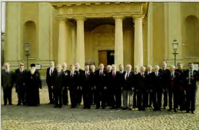
Перед Петропавловским Собором