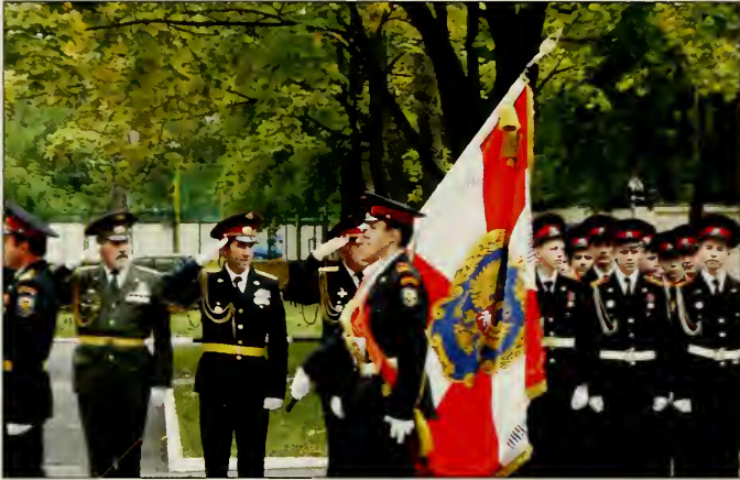
Знамя Московского Казачьего Корпуса