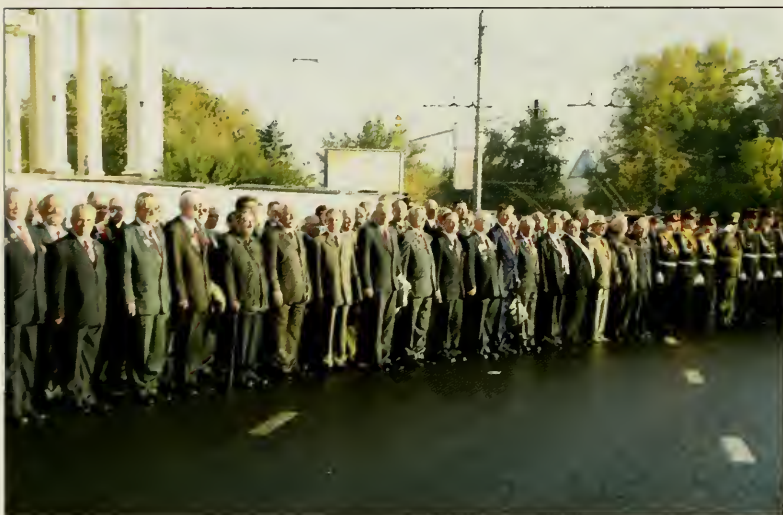
Строй суворовцев и нахимовцев