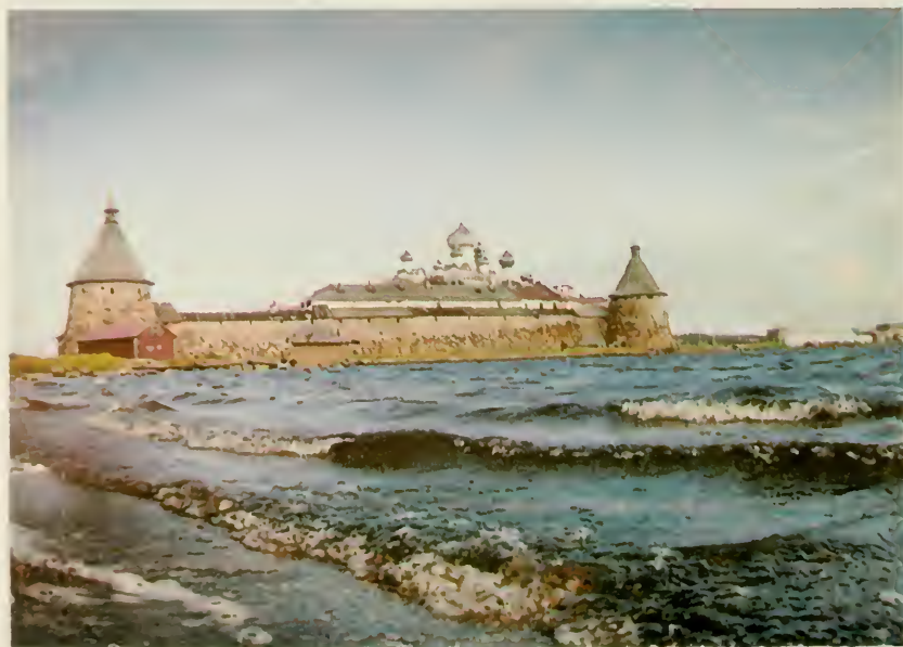
17. Соловецкий монастырь.