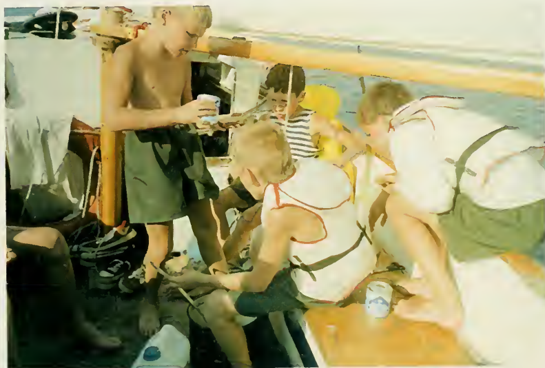
23. Кадеты Морских кадетских классов .