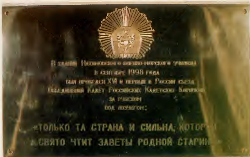
11. Памятная доска XVI Общекадетского съезда и I в России.