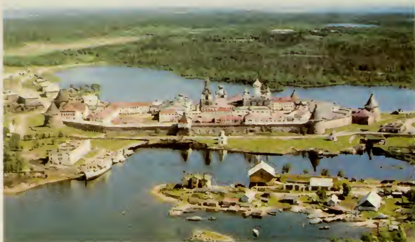
16. Соловецкие острова.