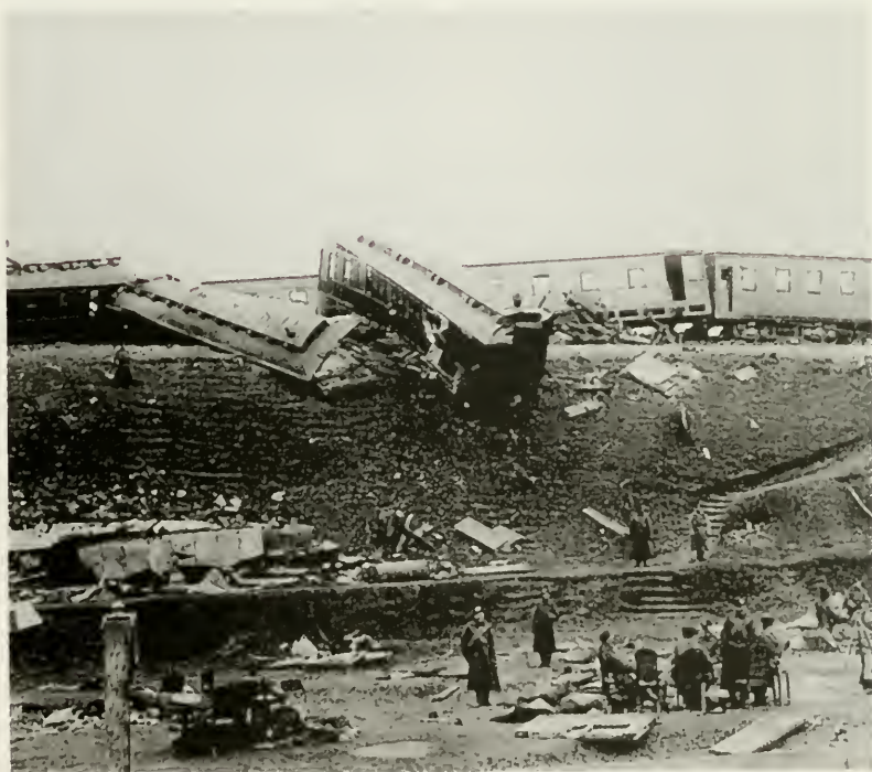
12. Крушение царского поезда в Борках. Окт. 1888 г.