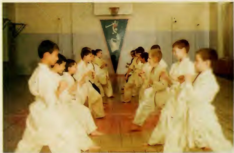
25. Кадеты Сибирского кадетского корпуса на занятиях по самообороне.