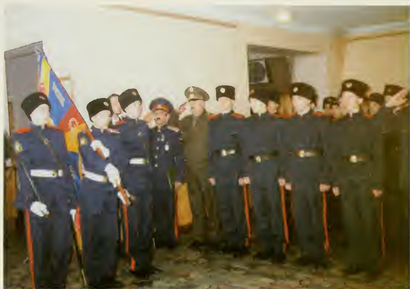
26. Кадеты Пензенского казачьего ген. Слепцова КК выносят знамя.