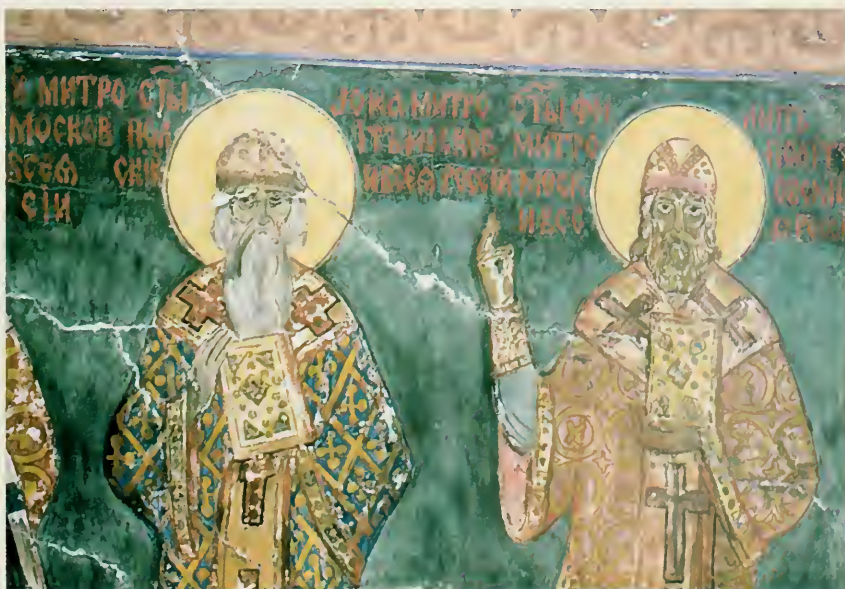
8. Поврежденные фрески в Св. Троицкой церкви.