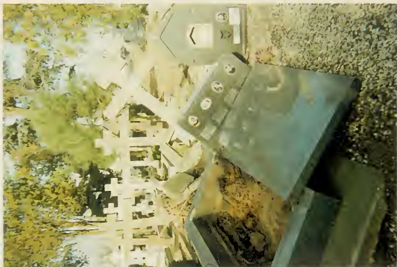
20, 21. Разрушения после бури на кладбище Сент Женевьев де Буа.