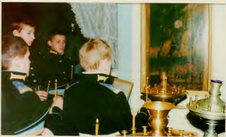
29. Кадеты Ачинского кадетского корпуса.