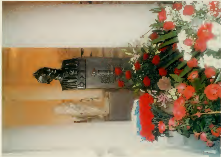
13. Открытие восстановленного 1-го этажа Благовещенского собора в С.-Петербурге. Могила и бюст А. Суворова