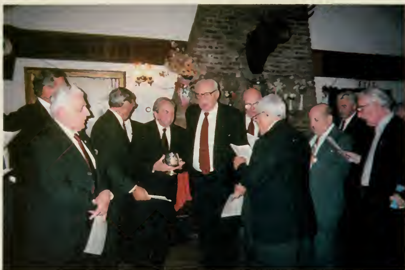
2. Кадеты поют «Звериаду» и пьют вино из кадетской «братины»