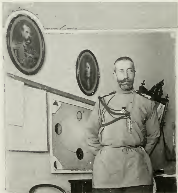
19. Великий князь Константин Константинович в форме 15-го Тифлисского гренадерского полка.