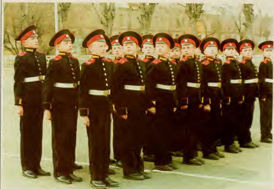
28. Кадеты Красноярского кадетского корпуса.