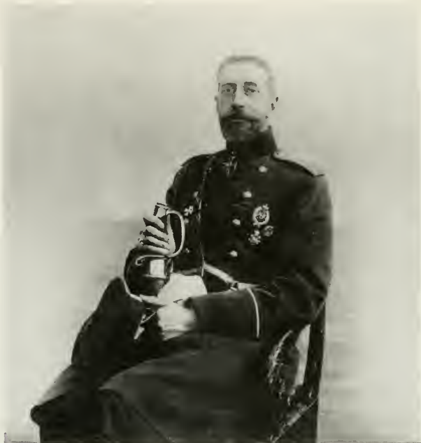
18. Великий князь Константин Константинович (13-го выпуска военно-педагогических курсов 1913 г.).