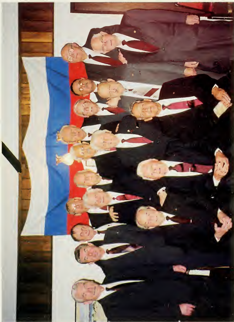
1. Група кадет на празновани 50-летия Нью-Йоркского объединения.