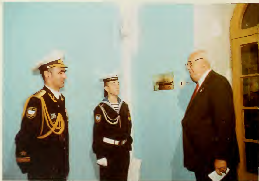
10. Открытие памятной доски в коридоре Нахимовского училища по поводу XVI Общекадетского съезда и I в России.