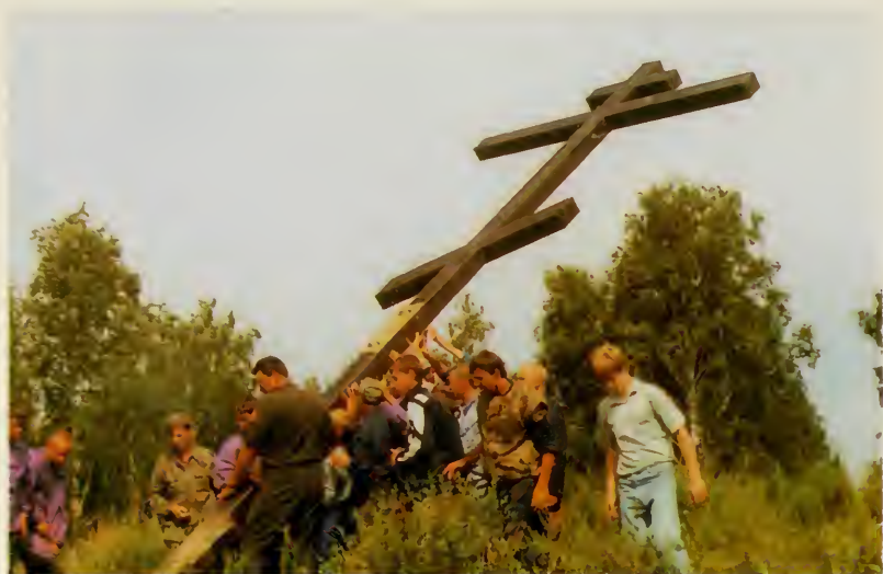
24. Кадеты Сибирского кадетского корпуса устанавливают крест на месте гибели дружины Ермака.