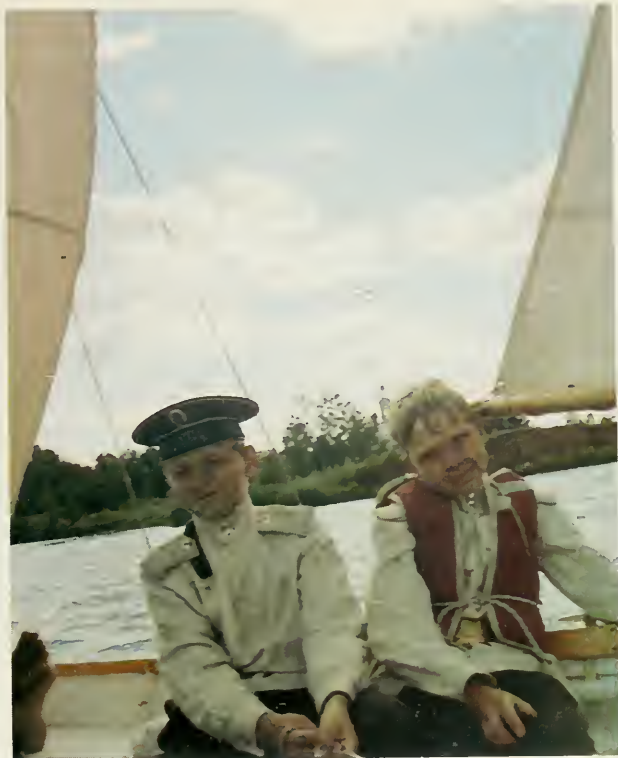
22. Кадеты Морских кадетских классов собираются в поход по Москва-реке.