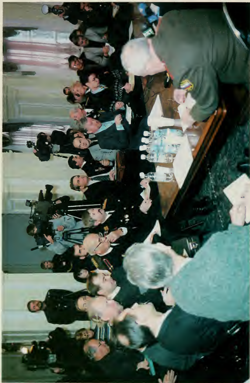
6. Директора корпусов и представители правительства