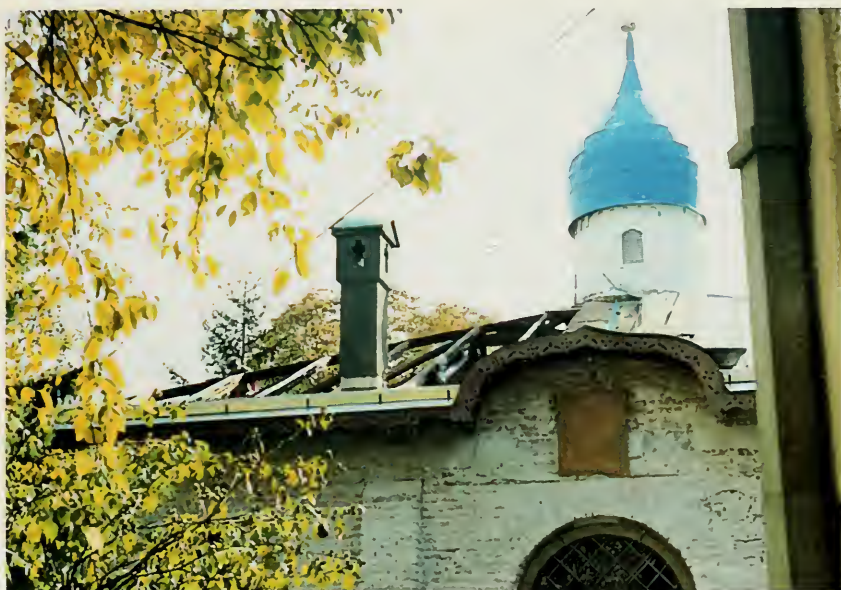
7. Св. Троицкая церковь в Белграде после бомбардировки.