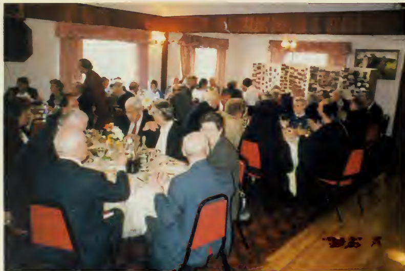
3. Парадный обед. На заднем плане фотовыставка, отражающая жизнь объединения за 50 лет.