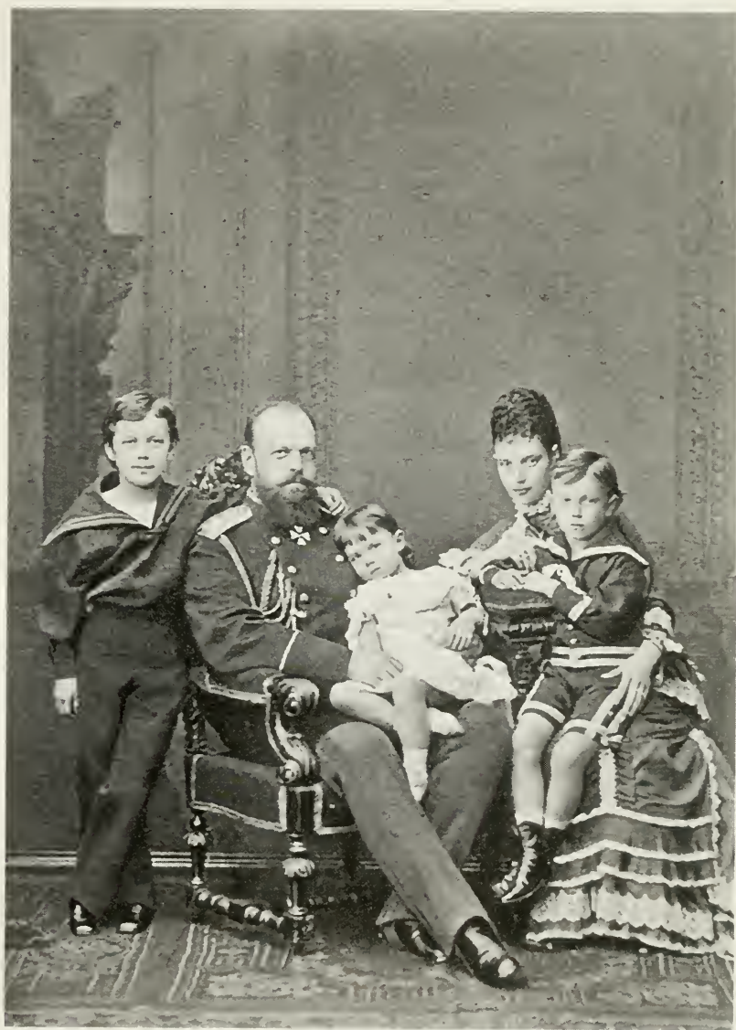
15. Слева направо: Цесаревич Николай Александрович, Император Александр III, Великая княжна Ксения, Императрица Мария Федоровна, Великий князь Георгий.