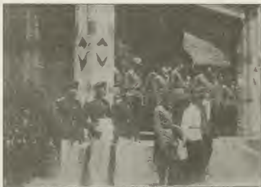
Передача традиций («Звериады») выпуском Омского Кадетского Корпуса.