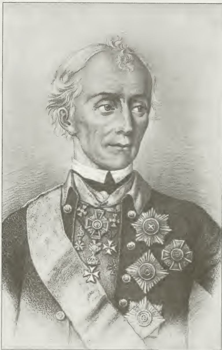
Генералиссимус А. В. Суворов, князь Италийский, Российской Армии Победоносец.