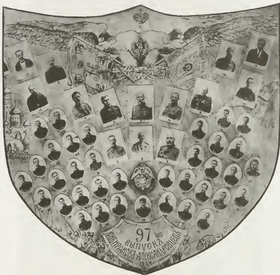
Последний 97-ой выпуск, в Шанхае в 1924 году, Первого Сибирского Императора Александра Первого Кадетского Корпуса.