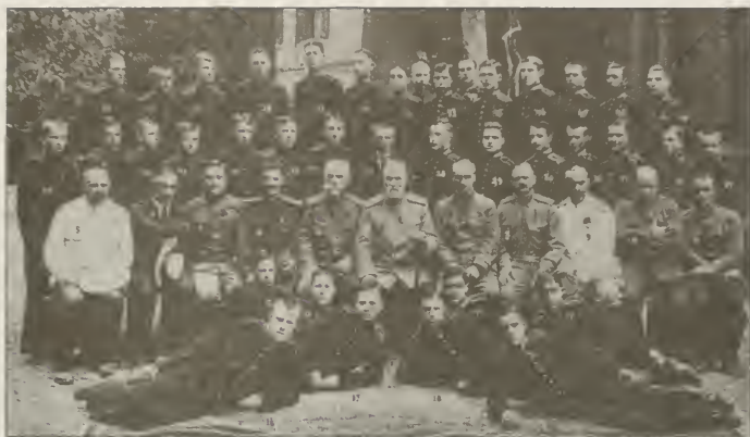
Группа кадет 19-го выпуска Хабаровского Графа Муравьева-Амурского Кадетского Корпуса в Шанхае, в 1923 году.