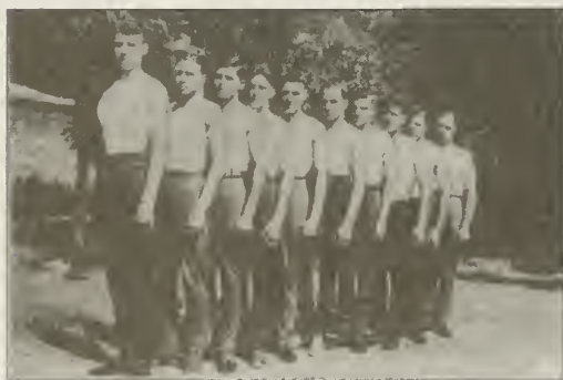
Лучшие гимнасты Хабаровского Кадетского Корпуса, на спортивных состязаниях в Шанхае.