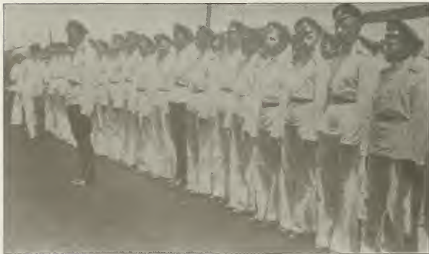
Строй кадет Сибирского Кадетского Корпуса, в Шанхае, в 1924 году.