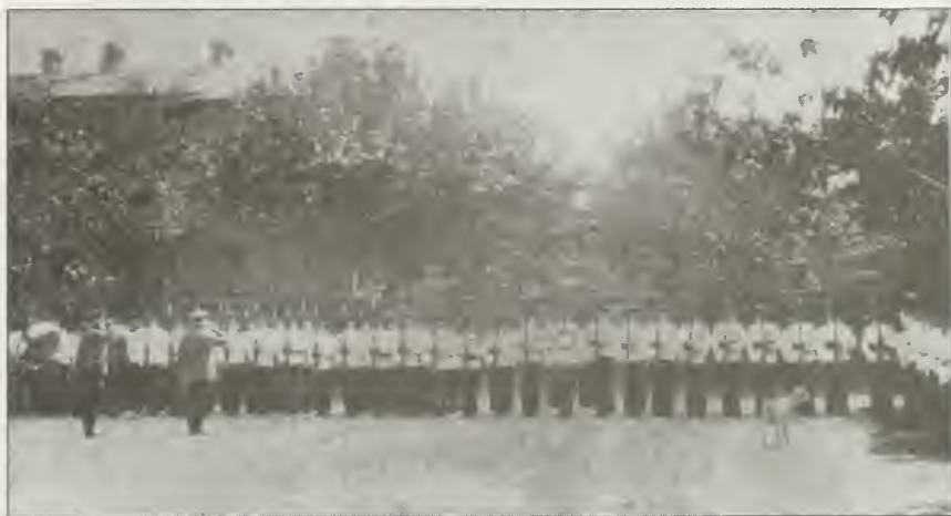
Смотр кадет Хабаровского Кадетского Корпуса французскими офицерами, перед началом несения кадетами караульной службы в Шанхае, в 1924 году.