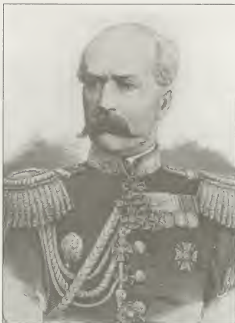
Генерал Н. И. Разгонов.