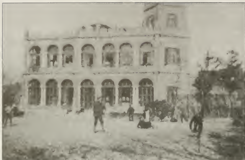
Здание, в котором помещались Русские Кадетские Корпуса первое время своего пребывания в Шанхае.