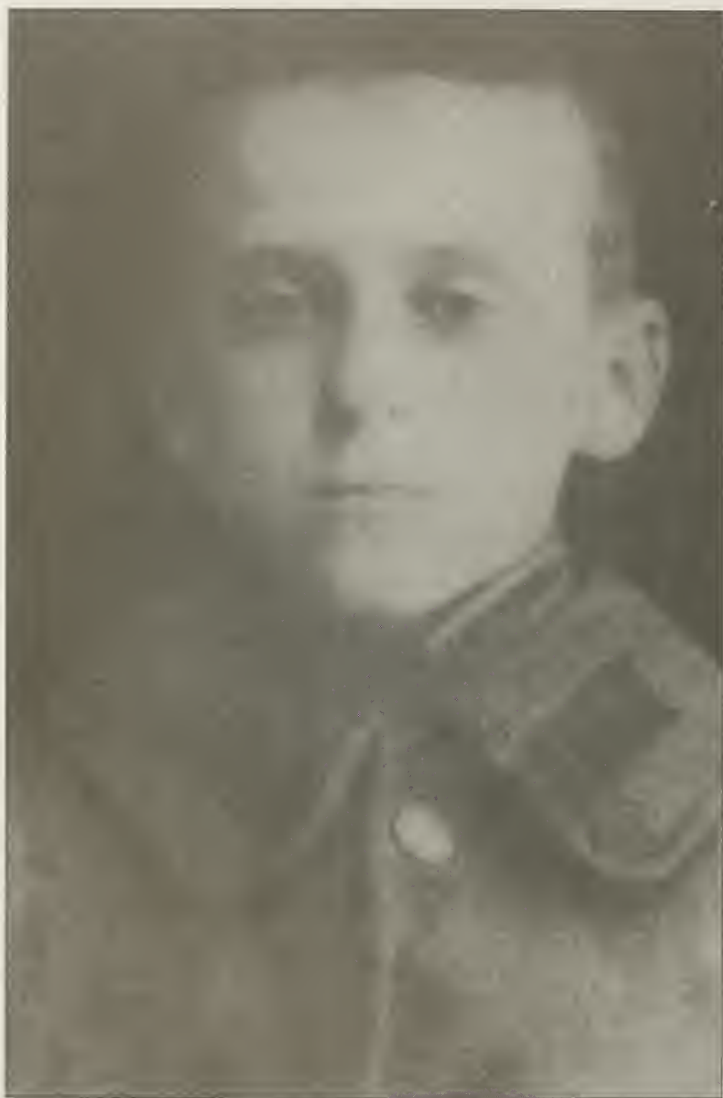
Будущий Митрополит Виталий, в Крымском Кадетском Корпусе.