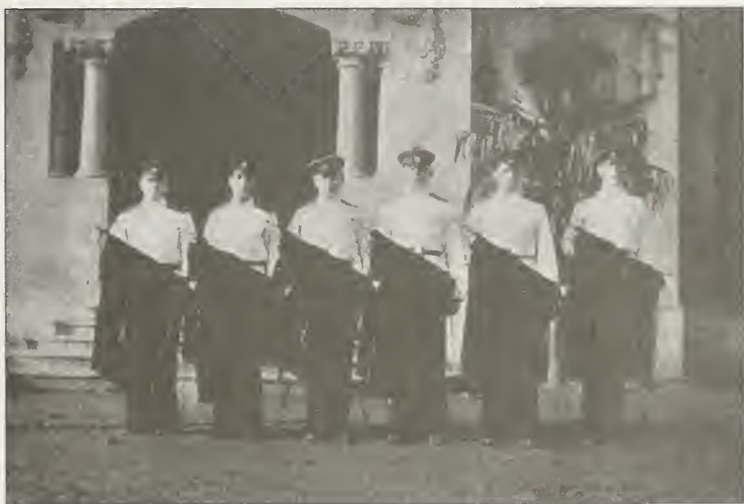
Фанфаристы Хабаровского Графа Муравьева-Амурского Кадетского Корпуса, в Шанхае.