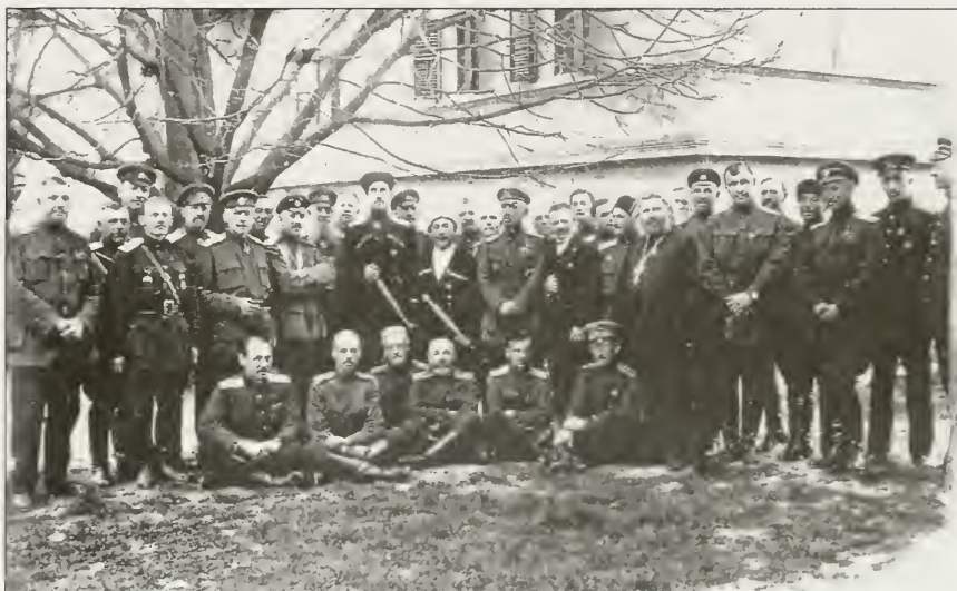
Главнокомандующий Русской Армией генерал П. Н. Врангель, со своим Штабом, в Югославии.