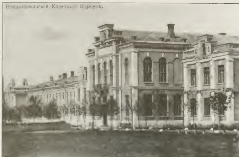
Здание Владикавказского кадетского корпуса.