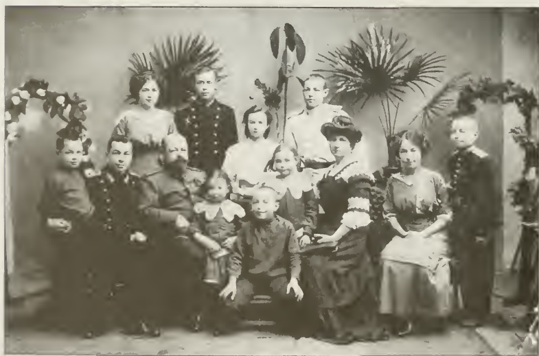
Русская типичная военная (кадетская) семья в Харькове в 1913 году.