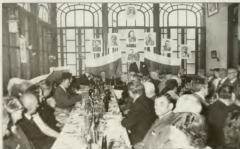
Кадетская встреча в Аргентине, в 1970-ые годы.