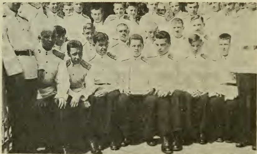
Группа со Звериადой — Шанхай 1924 г.