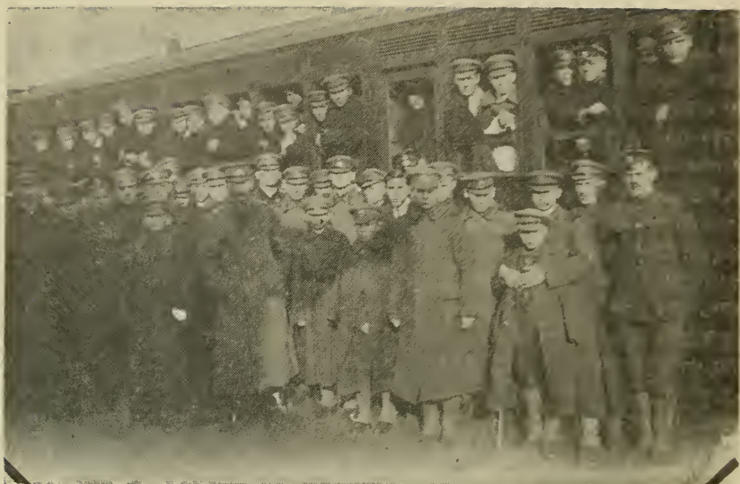
Отъезд Сибиряков в Крагуевац в конце сентября 1925 г. на слесарно-монтажные курсы.