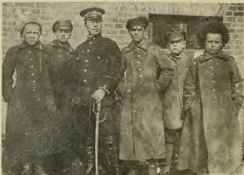
Младшие кадеты в 1922 г. в лагере в Мугдене с японским жандармом.

также-то лица приняты на службу и не будут обременять общество. С этими удостоверениями сошли на берег все: каждая группа в 25 человек, сойдя на берег, находила способ вернуть свои удостоверения обратно на корабль и ими пользовалась следующая группа и т. д. Оба корпуса, и Сибирский, и Хабаровский, были помещены вместе, в вилле одного отсутствовавшего иностранца на Джесфилд Род № 4.