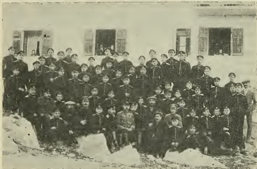
Сибиряки-Александровцы в Сплите

Через 4 дня плавания по Средиземному морю «Партос» подошел к берегам Югославии. Перед кадетами открылся Сплит, расположенный на склоне Далматинских гор. В 9 ч. утра, 9 декабря, кадет высадили на мол, туда же навалили корпусные вещи и пароход, дав прощальный гудок, ушел дальше, продолжая свой путь. Кадеты оставались на молу почти целый день, т. к. помещение для них еще не было приготовлено. Наконец, к 4 ч. дня было приказано построиться и корпус, под звуки мрамаша, отправился к отведенным для него казармам 11-го пех. полка. Они были укреплены и походили на небольшой форт.