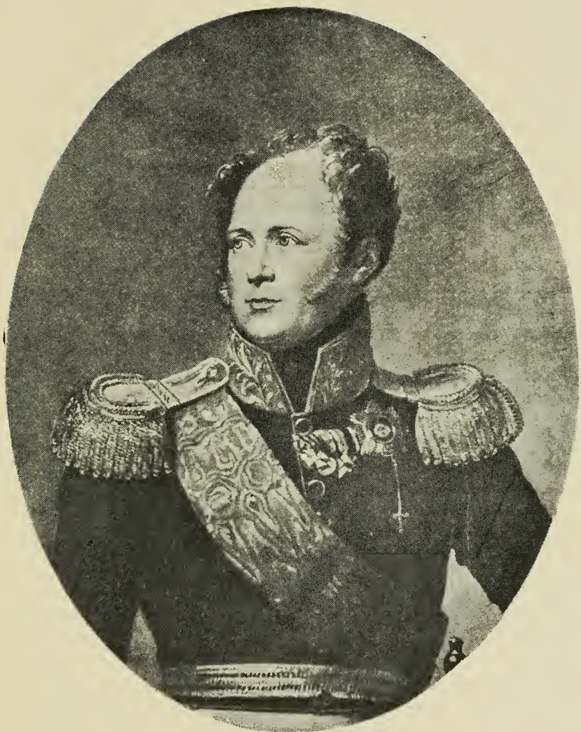
Державный Основатель Корпуса. Его Императорское Величество Государь Император АЛЕКСАНДР I