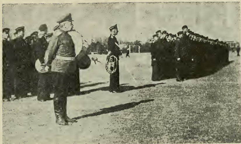
Корпусной Праздник — 19 декабря

В день корпусного праздника 6/19 декабря, после торжественного богослужения, директор ген. Руссет принял парад кадет, которые прошли перед ним церемониальным маршем, под звуки фанфар, в присутствии многих зрителей, наблюдавших за кадетами с нескрываемым любопытством и одобрением. Вечером в этот день, во французском Клубе состоялся большой бал; перед началом бала была поставлена инсценировка стихотворения кадета Морозовича «Возрождение России». Во время действия оркестр тихо исполнил национальный гимн «Боже, Царя храни!», при первых звуках которого публика заполнившая обширное помещение клуба, встала и прослушала его стоя. В концертной программе перед балом участвовали и кадеты, и видные артисты, находившиеся в то время в Шанхае. Бал привлек массу международной публики и прошел исключительно успешно.