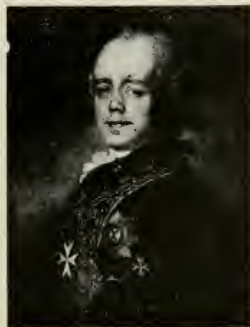
Императоръ Павелъ I.

«Кто видѣлъ Бистрома съ храбрыми Лейбъ-Гвардіи Егерскимъ полкомъ, обороняющаго мостъ въ Бородинской битвѣ, тотъ, при желаніи воспламенить душу и приподнять духъ солдата, не будетъ прибѣгать къ рыцарскимъ временамъ, и не станетъ искать въ сѣдой старинѣ, для личной храбрости лучшаго примѣра. Напрасный трудъ. Бывали равные, но лучшимъ быть нельзя. Бистромъ показалъ въ себѣ все, что можетъ кисть генія выискать, нарисовать и представить въ похвалу высокой души вѣрнаго Царю воина, съ рѣшительнымъ презрѣніемъ къ собственной жизни, но съ нѣжной любовью сына, защищающаго каждый шагъ родной земли, и вмѣстѣ съ лютою съ тигра, мстящаго за оскорбленную честь милого отечества. Подобные подвиги нельзя описать солдатскимъ перомъ. Это поэзія — какъ говорятъ сочинители; здѣсь нужны: огненная голова, горящій языкъ, пламеннѣющее сердце и, вмѣстѣ чернилъ, кипящая кровь». Въ этомъ же бою 26 августа