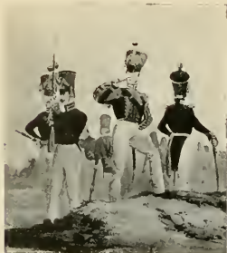
Волторнисть и Егеря послѣ 1817 г.

Ивангородомъ и др. слѣдуютъ одинъ за другимъ.