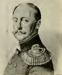
Императоръ Николай I.

2-ой баталіонъ пополняется изъ 13 и 14 Егерскаго полковъ и по-