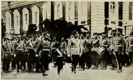
Полковой праздникъ въ Высочайшемъ присутствіи въ Петергофѣ въ 1912 году.

Въ 2 часа къ французамъ подходятъ свѣжія силы. 4 баталіона снова атакуютъ Гвардейскихъ Егерей, но послѣдніе стоятъ твердо. Подожженная артиллерійскимъ огнемъ деревня Страденъ пылаетъ. Генералъ Бистромъ отводитъ егерей на опушку лѣса. Французы бросаются преслѣдовать и втягиваются въ лѣсную прогалину. Но въ это время, давъ залпъ изъ кустовъ по обѣ стороны прогалины, егеря бросаются въ штыки. Мало кому удалось спастись отъ смер-