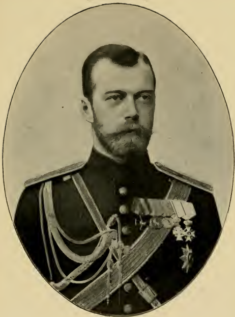
Его Императорское Величество Государь Императоръ НИКОЛАЙ II АЛЕКСАНДРОВИЧЪ